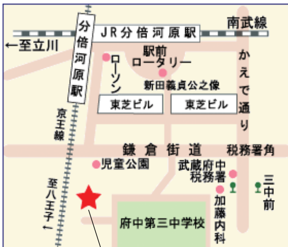
ヘルス・ケア・ヴィラ府中

※各日15名とさせていただきますので、参加ご希望の方はご予約をお願いいたします。