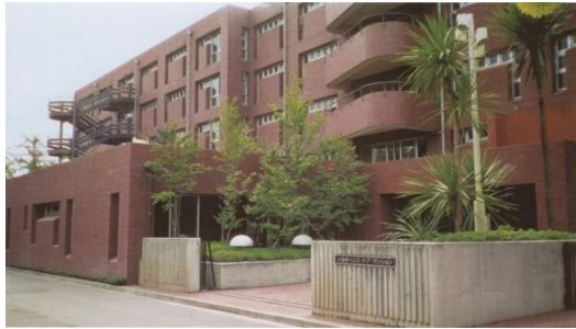
自立したシニア向けマンション