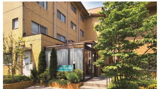
介護付き有料老人ホーム